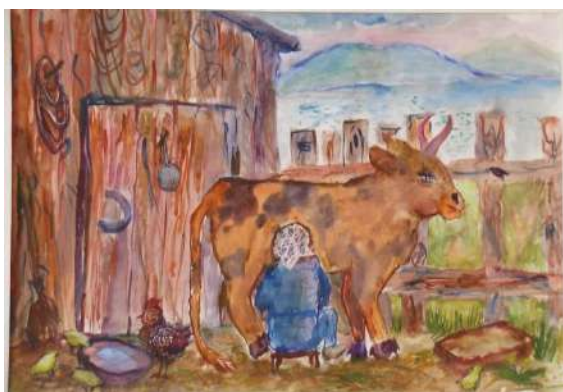
Ляпина Светлана 13 лет