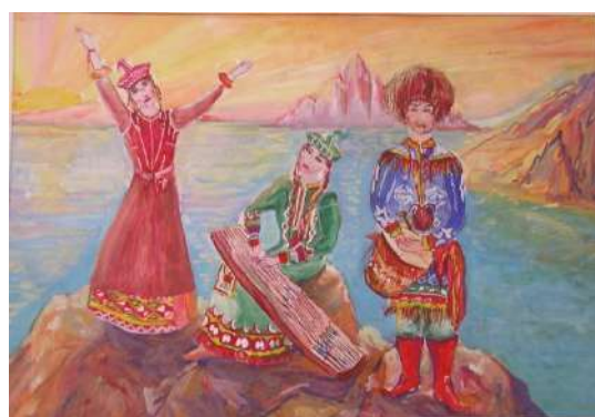
Хрунык Евгений 14 лет