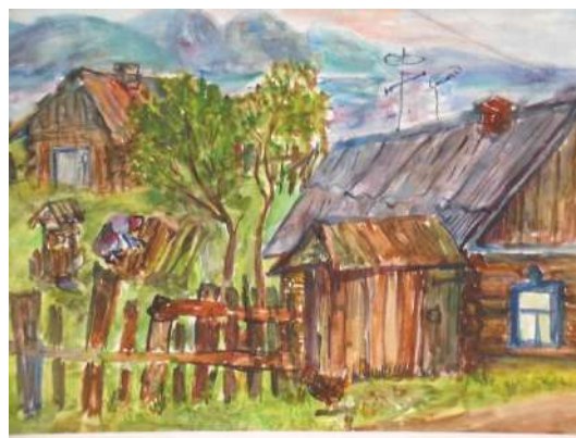
Беспалько Дарья 13 лет