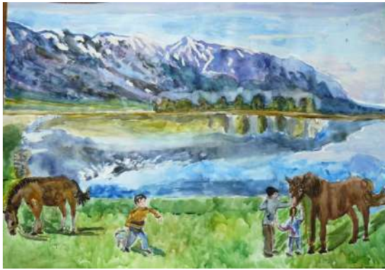
Абясова София 14 лет