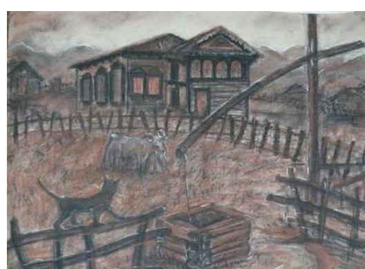
Луенюк Ольга 14 лет