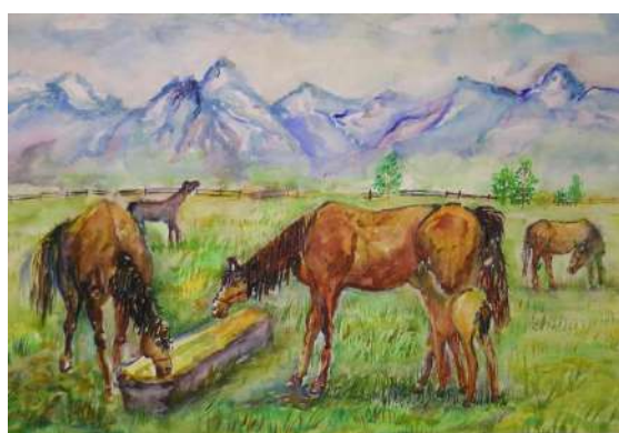
Хрунык Евгений 13 лет