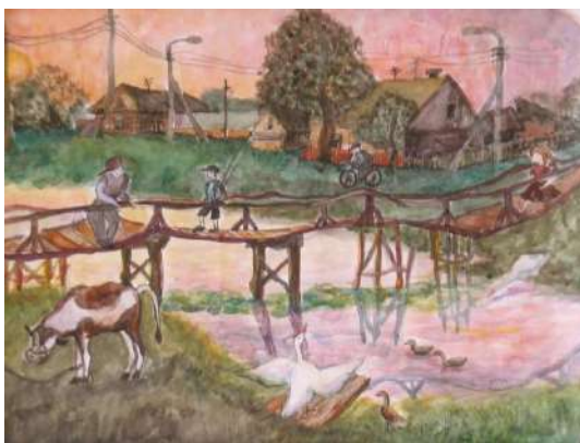
Луненок Ольга 15 лет